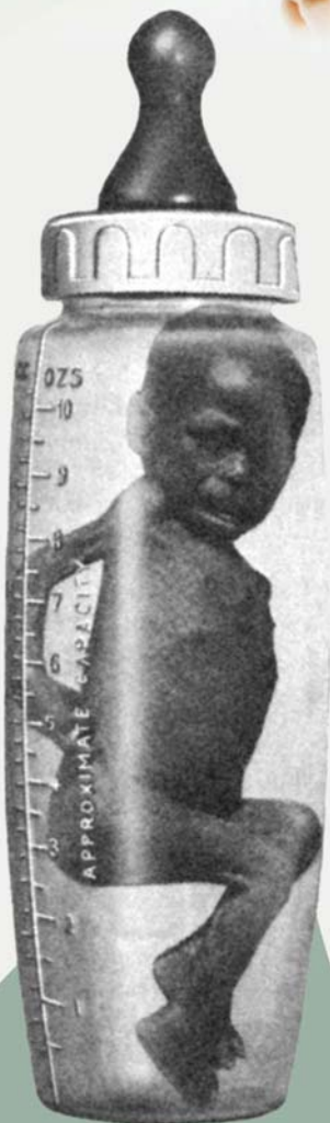
Foto montagem usada na capa do livro The Baby Killer , 1974.