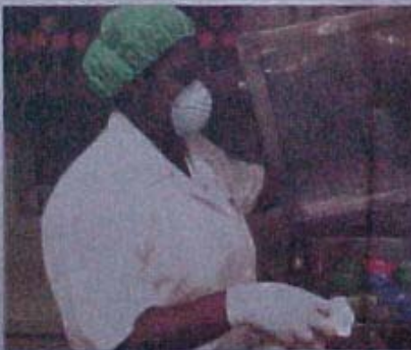
O IFF é uma instituição de saúde pública do Estado do Rio de Janeiro.

Depois de vencer a Prêmio de Saúde da Criança da Organização Mundial de Saúde (OMS) criado a pedido do Conselho Nacional de Saúde em 1998, o Instituto Fernandes Figueira (IFF) de Petrópolis, no Estado do Rio de Janeiro, recebeu o prêmio de melhor instituição de saúde pública do mundo em 2000. A OMS reconheceu o trabalho do IFF em Petrópolis, no Estado do Rio de Janeiro, na área de Saúde da Criança, em 2000. O IFF é uma instituição de saúde pública do Estado do Rio de Janeiro, fundada em 1934, com o objetivo de promover a saúde da população e a melhoria da qualidade de vida. O IFF é uma instituição de saúde pública do Estado do Rio de Janeiro, fundada em 1934, com o objetivo de promover a saúde da população e a melhoria da qualidade de vida.