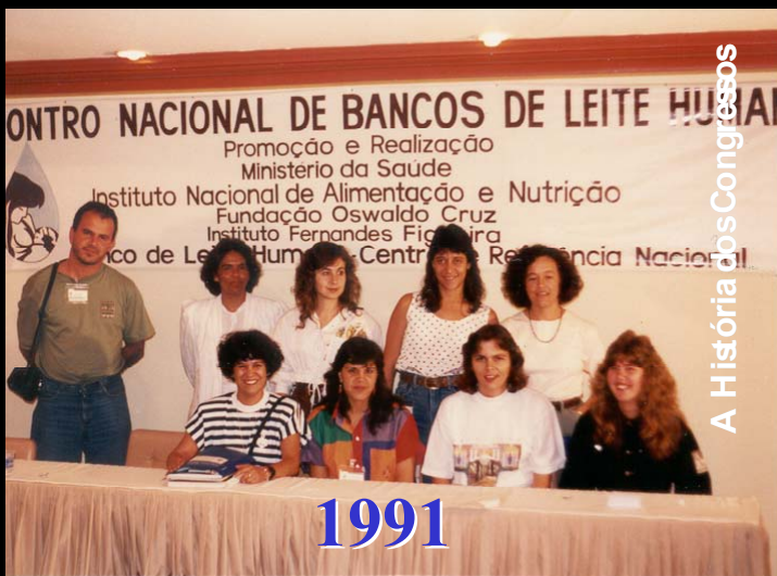
A História dos Congressos