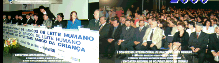
A História dos Congressos