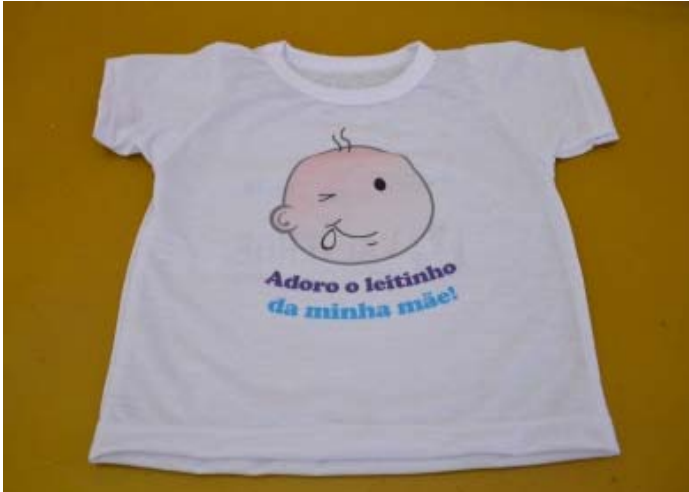
Camiseta para os bebês