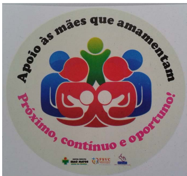
Adesivo com slogan da SMAM