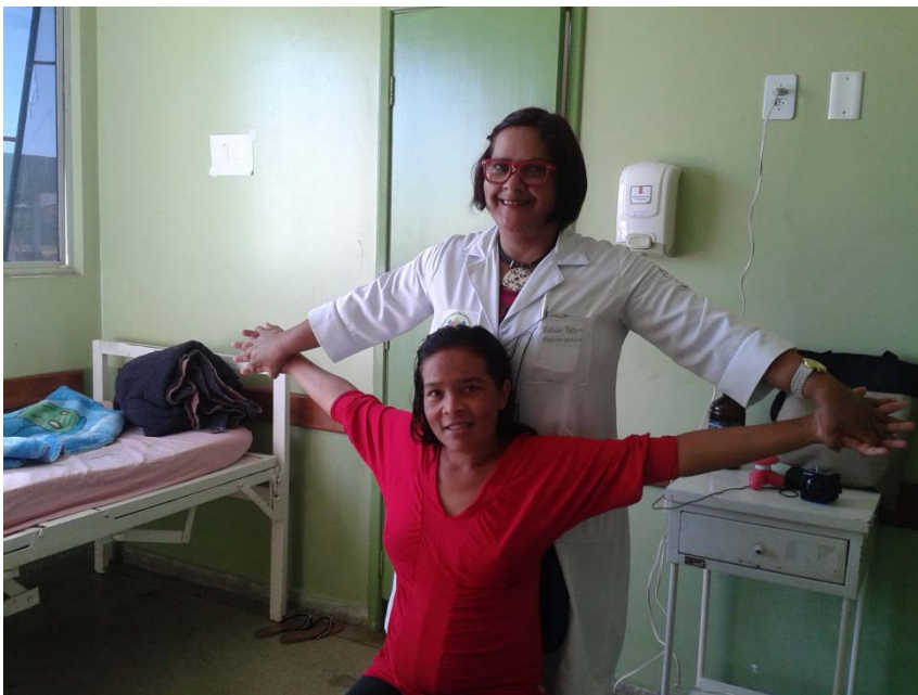
Atividade de relaxamento com as puérperas do Alojamento Conjunto da Instituição