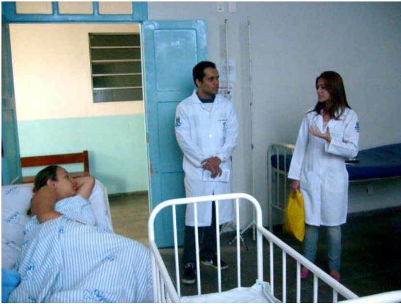
Palestra às puérperas das maternidades do Município