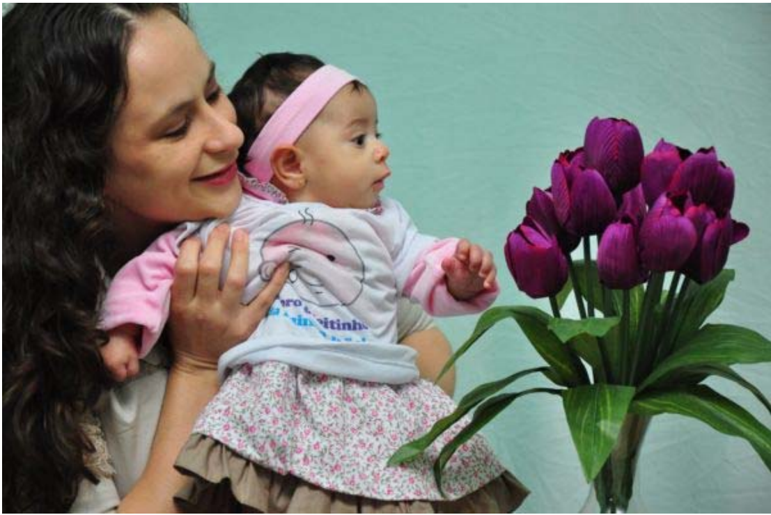
'Um dia de Estrela'