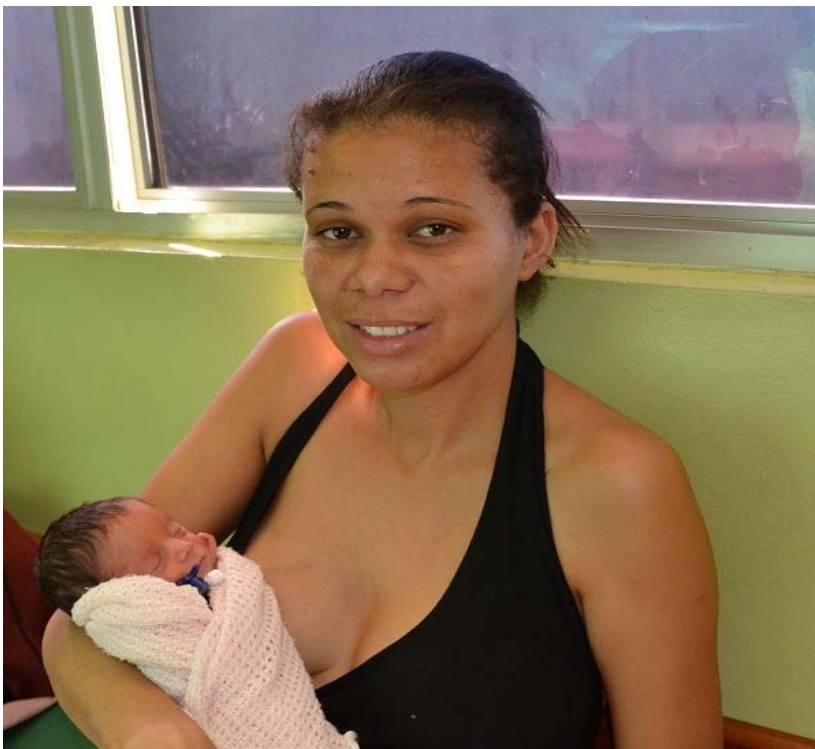
Palestra às puérperas do Alojamento Conjunto da Instituição