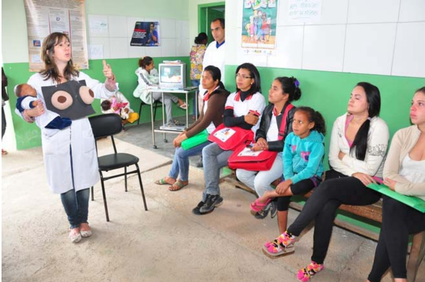
Palestra às gestantes dos PSF