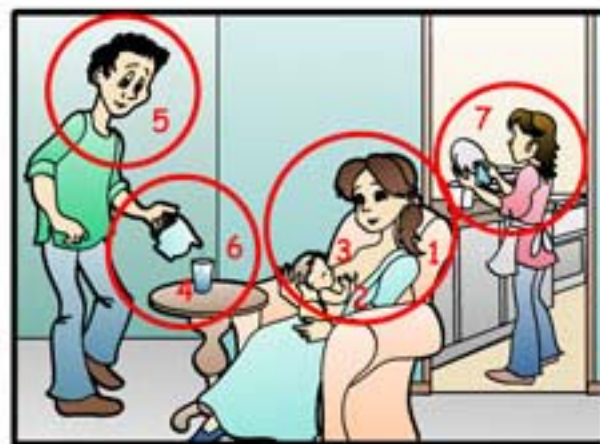
IMAGEM A: Mulher com as costas curvadas pra frente (1), bebê no colo dela, com a barriga virada pra cima (2), bebê mama abocanhando somente o bico, com bochechas encovadas (3), chupeta em cima da mesa, atrapalhando a amamentação (4), marido dando pouca atenção, falando no celular (5), não tem água pra mulher beber próximo à ela (6), há uma pia cheia de louça ao fundo, sobrecarregando a mulher (7) Mulher está com fisionomia de dor.

IMAGEM B: Mulher com as costas retas, bem posicionada (1), bebê no colo dela, de frente, "barriga com barriga" (2), bebê abocanha a aréola toda e está com bochechas arredondadas (3), não tem chupeta na mesa (4), o marido está próximo à mulher, apoiando-a (5), há um copo e uma garrafa de água próximos à mulher (6), há uma vizinha ajudando com as tarefas domésticas, lavando a louça (7) Mulher está com a fisionomia tranquila e feliz.