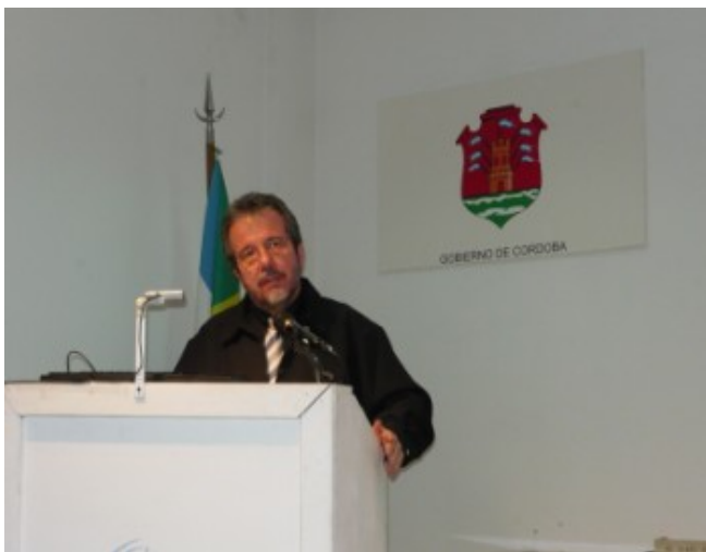
Coordinadores de los Bancos de Leche de Argentina

Se llevó a cabo en el Hospital Materno Infantil con motivo de la Semana Mundial de la lactancia materna.