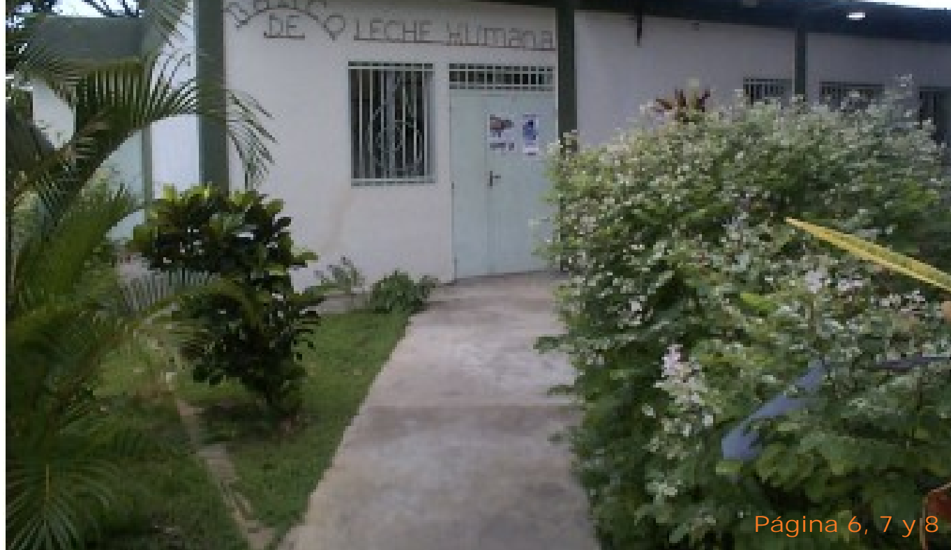
Página 6, 7 y 8