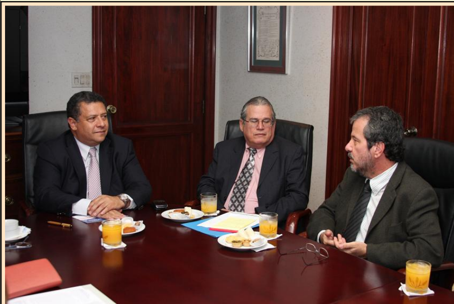
Reunión con el Ministro de Salud, Dr. Franklin Vergara

Se realizaron reuniones con gestores y técnicos del Ministerio de Salud de Panamá (MINSAL), de la Caja de Seguridad Social (CSS) y de hospitales locales involucrados en el proceso, para presentar el modelo de actuación de los Bancos de Leche Humana en Brasil y en Iberoamérica.