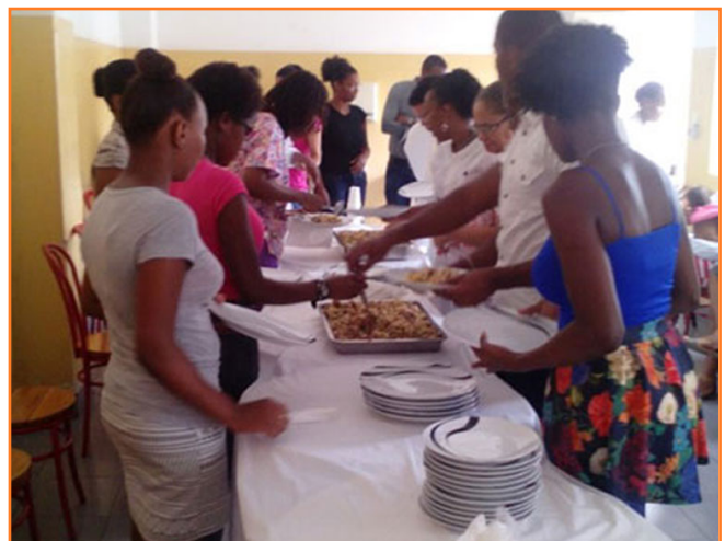
Almuerzo de confraternización