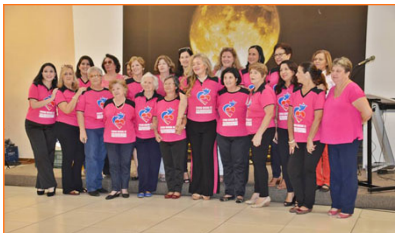
Equipo del Fondo Social de Solidaridad de Marília