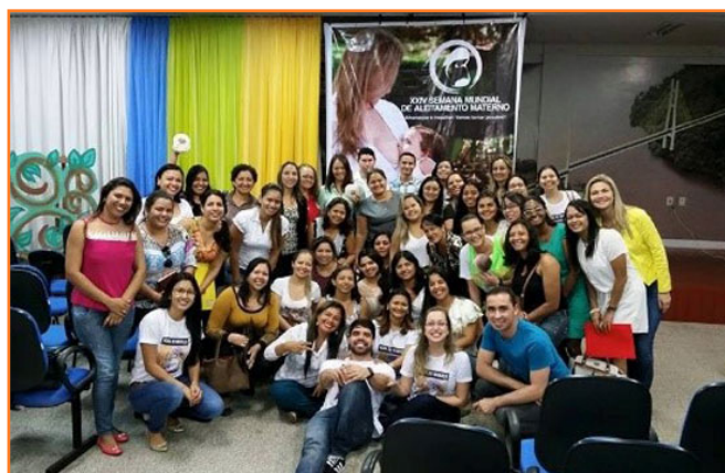
Clausura de la SMLM 2015