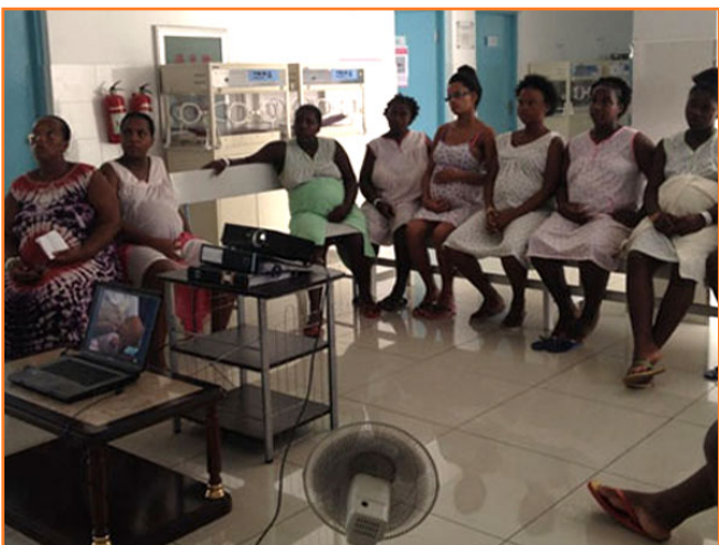
Proyección de videos para las mujeres embarazadas en la maternidad