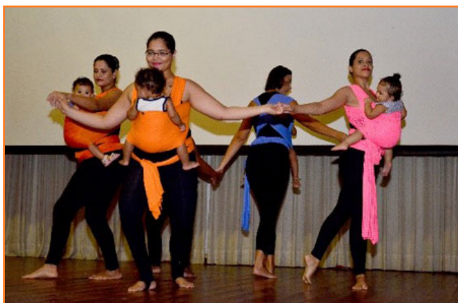
Danza Materna en la Apertura de la SMLM 2015