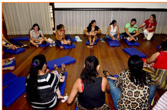
Masaje Shantala con Madres y Bebés