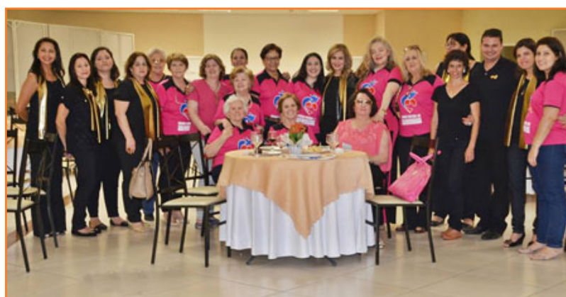
Equipo del Fondo Social de Solidaridad con equipo del BLH Dr. Cleyde Moerbeck Casadeis