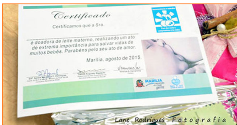
Certificado entregado a las madres donantes de leche materna