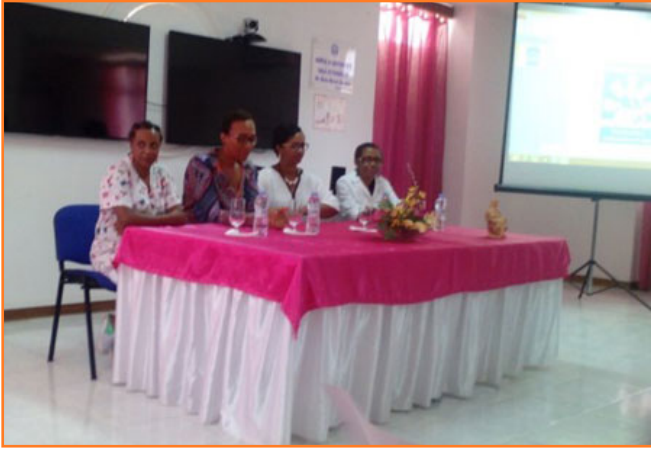
Enfermera superintendente; directora del HAN; madrina de la campaña 2014-2015; coordinadora del BLH