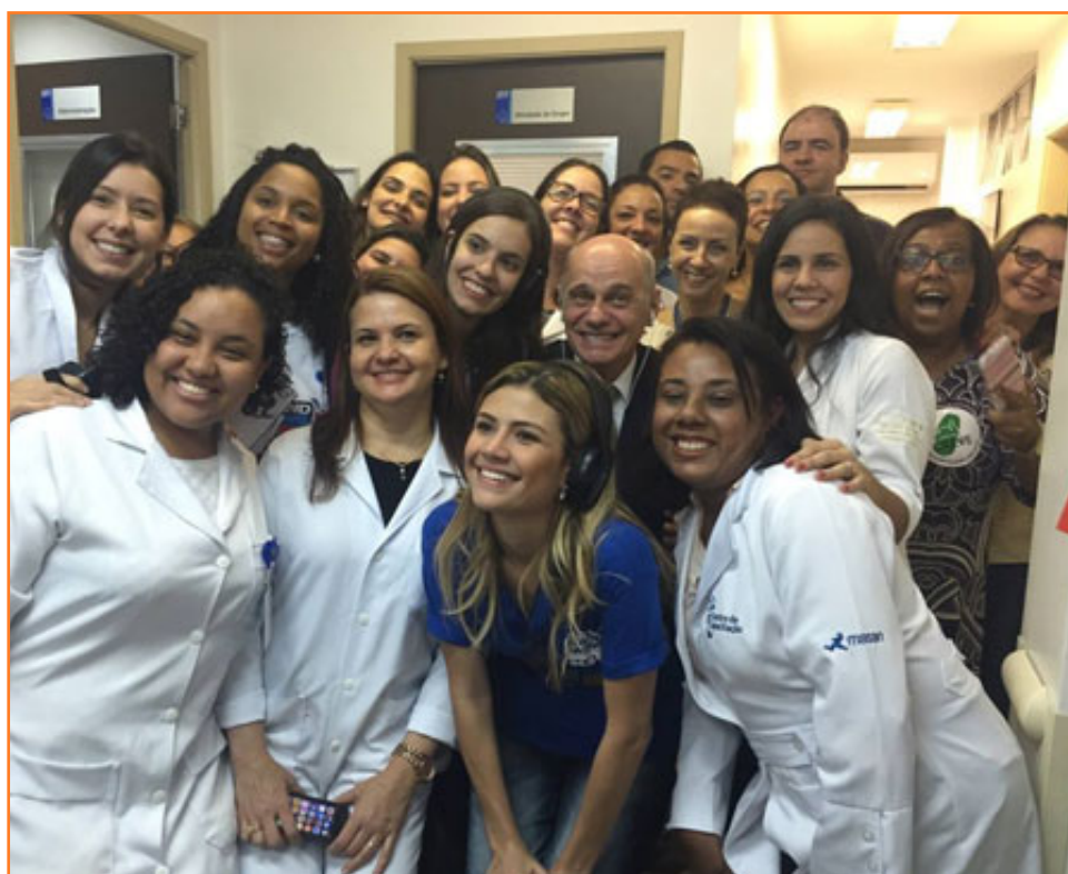
Equipo del IFF/Fiocruz en BLH con el periodista Ricardo Boechat y su equipo