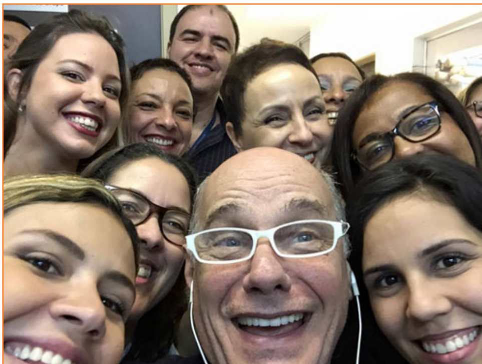
Selfie de la equipo del IFF/Fiocruz en BLH con el periodista Ricardo Boechat