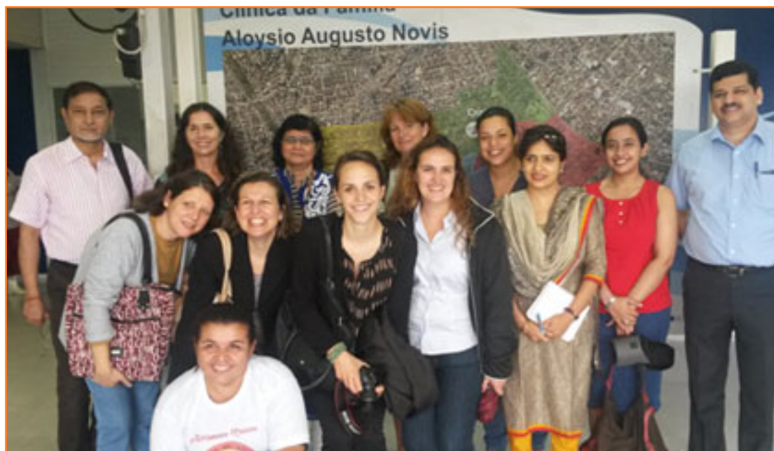
Visita a la Clínica de la Família Aloysio Augusto Novis, en el barrio Penha, RJ