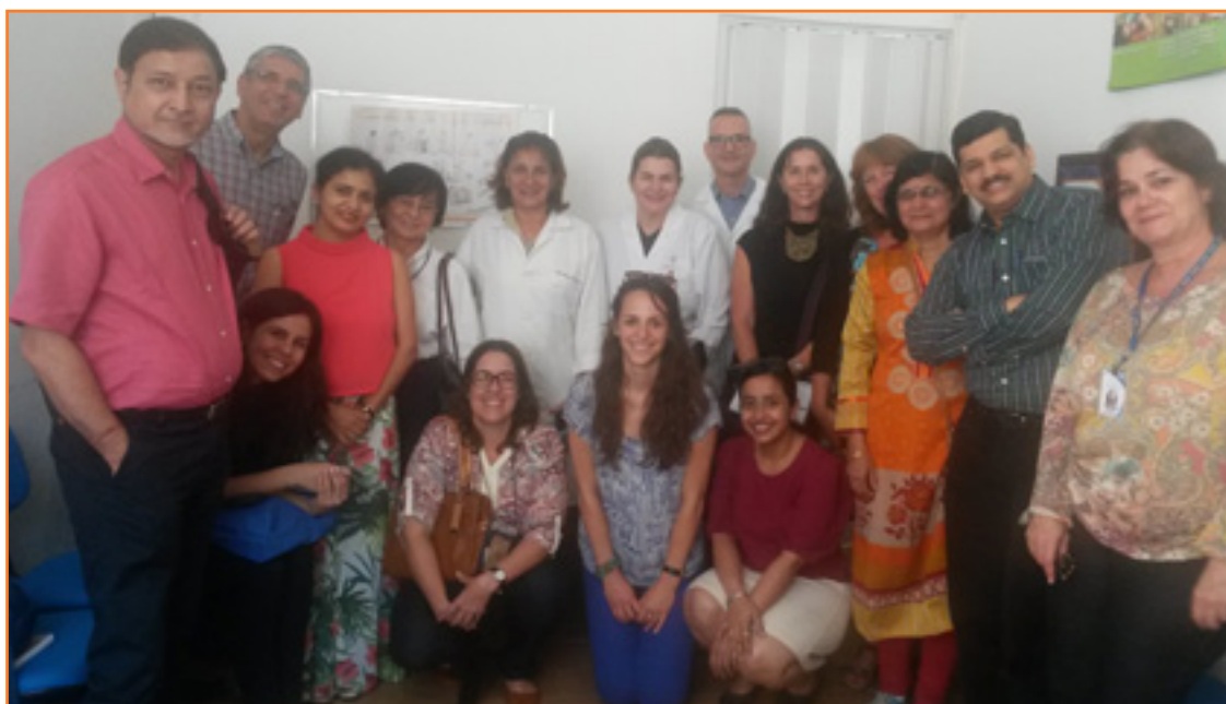
Visita al centro de recolección de la Maternidad Municipal Alzira Reis, en Niterói, RJ