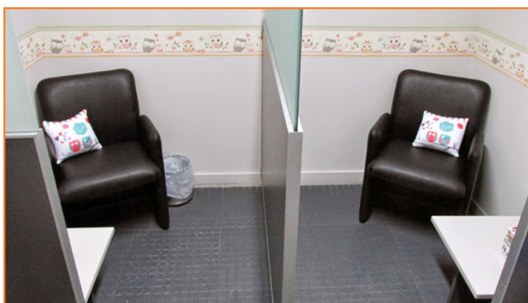
Foto ilustrativa de una Sala de Apoyo a la Lactancia Materna.

El lactario del Poder Judicial, que ya está listo y próximo a inaugurarse, equivaldría a lo que la ley prevé como Espacio Amigo de la Lactancia Materna, es decir, una área con privacidad dotada de las comodidades necesarias para que las madres puedan extraerse leche y conservar esta a la temperatura adecuada hasta el horario de salida, para luego dársela al bebé. El primero se inaugurará en Tribunales I. Luego se replicará en los otros edificios.