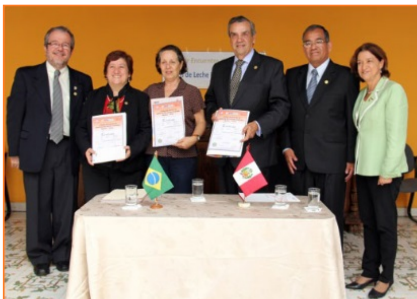
Autoridades reunidas en el primer día del I Encuentro de BLH Perú-Brasil

Por ello, recalcó la importancia de contar con Bancos de Leche Humana, debido a que la práctica de la lactancia materna disminuye las infecciones, desnutrición y anemia en los niños. “Esta iniciativa que implementamos con el apoyo de Brasil, que nos ayudará a extenderlo mediante una red, nos permitirá reducir la mortalidad del prematuro a nivel nacional”, indicó. Asimismo, explicó que el Perú está por detrás de otros países en Latinoamérica, ya que solo cuenta con 3 bancos de leche humana. “Estamos invirtiendo en infraestructura en todas las regiones, por eso encomiendo al INMP planificar la implementación de más BLHs. Por su parte, el embajador de Brasil en Perú, Carlos Lazary Teixeira, sostuvo que el Programa Iberoamericano de Bancos de Leche Humana es uno de los grandes éxitos en el mundo de la cooperación sur, por lo que es interés de su país ayudar al movimiento de Bancos de Leche Humana en el Perú para priorizar la salud de los niños en los primeros años.