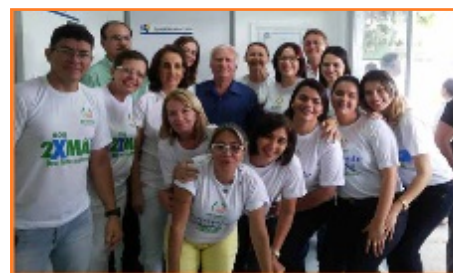
Reinauguración del BLH del Piauí

Brasília. Inaugurada el día 02 de julio de 2014.