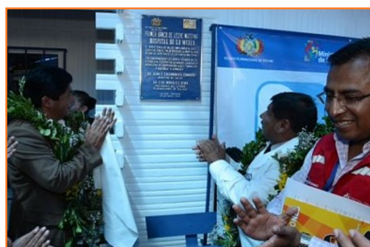
Inauguración del Hospital de la Mujer

El Ministerio de Salud del Estado Plurinacional de Bolivia inauguró, el día 10 de abril, el primer Banco de Leche Humana del país. La infraestructura está localizada en el Hospital de La Mujer, en La Paz.