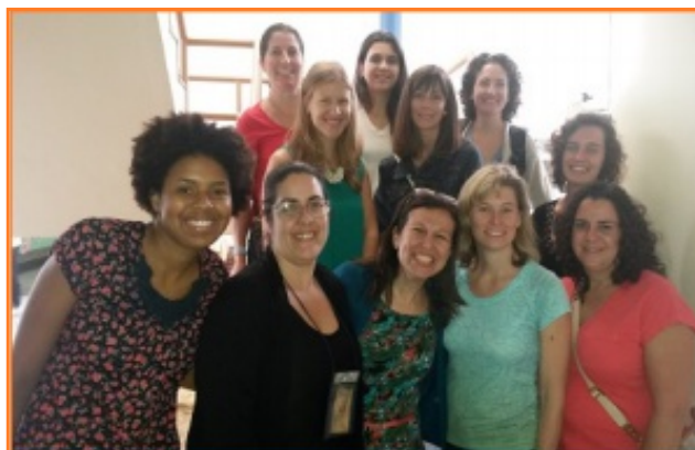
Visitando la Maternidad Herculano Pinheiro en la ciudad de Niterói