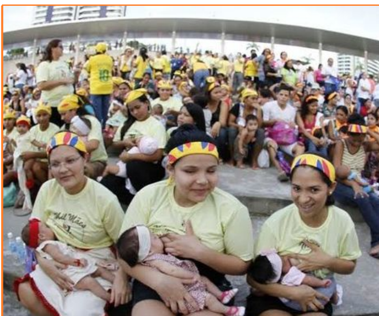
Intitulada "Mil Madres Amamantando", la acción ocurre cada dos años en diversas capitales del país (Evandro Seixas)