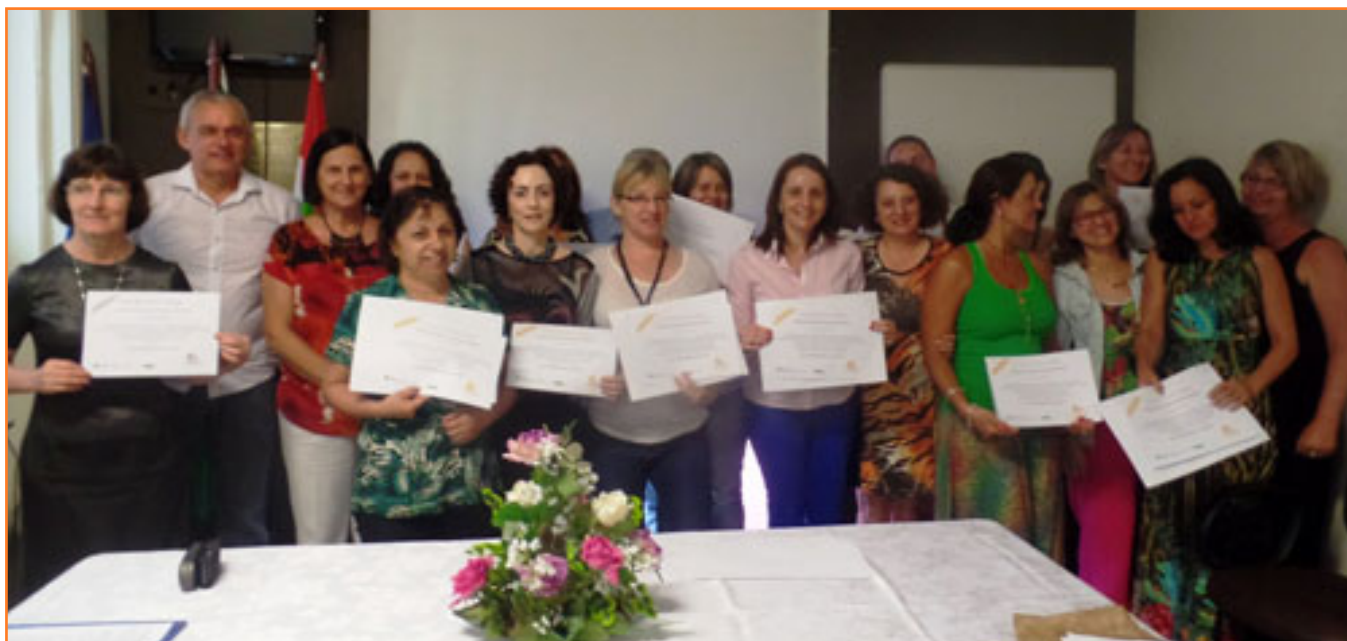
Participantes en la ceremonia de entrega de los Certificados de la Acreditación 2014 - rBLH-BR