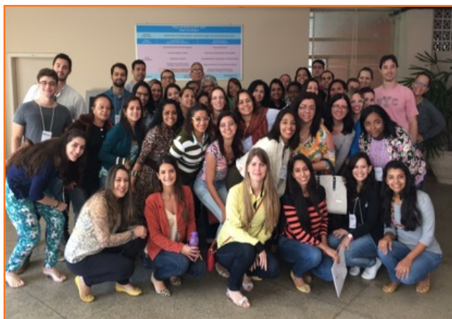
Los 07 BLHs en alianza con la SES

La red Capixaba de Bancos de Leche Humana realizó varias acciones en pro de la temática de la Semana Mundial de la Lactancia Materna en los diferentes BLH del estado: BLH Santa Casa de Misericórdia, BLH Cachoeiro Itapemirim, BLH del Hospital de la Policía Militar, BLH del Hospital Universitario Cassiano Antônio de Moraes, BLH del Hospital Dr. Dório Silva, BLH del Hospital General e Infantil Dr. Alzir Bernardino Alves y BLH del Hospital Maternidad São José de Colatina. Vea algunas de las actividades: