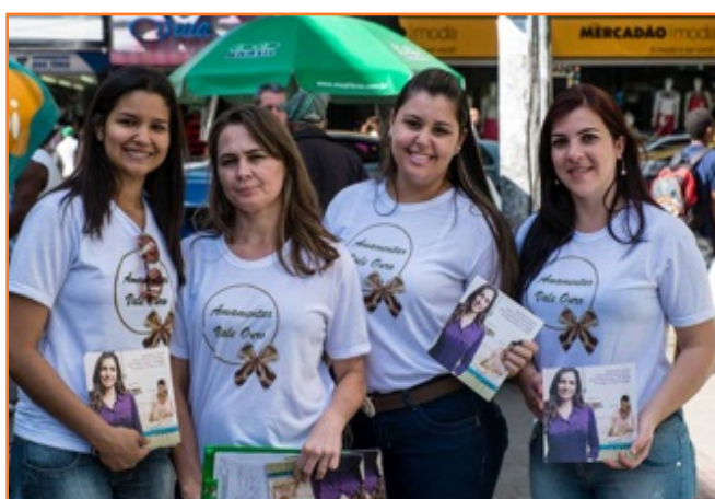
Captación de Donantes