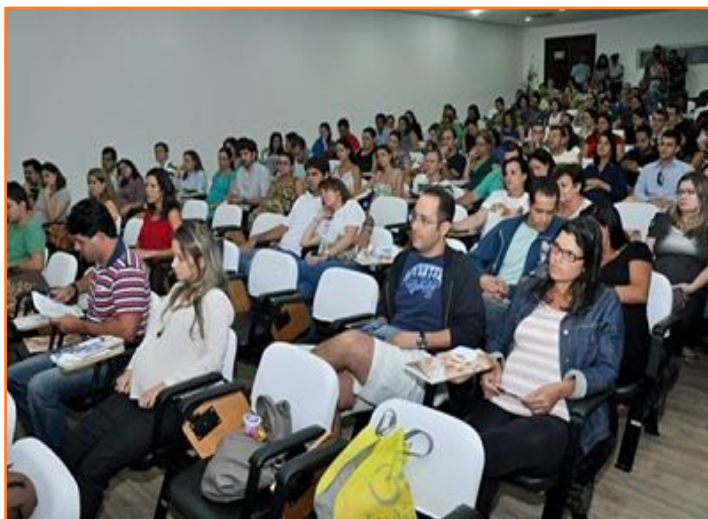
Curso para Gestantes/Pareja