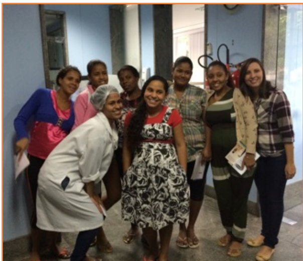
Rueda de conversación con Gestantes