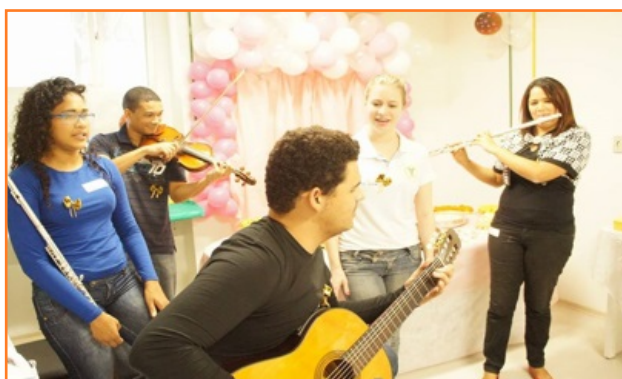
Homenaje a las Donantes