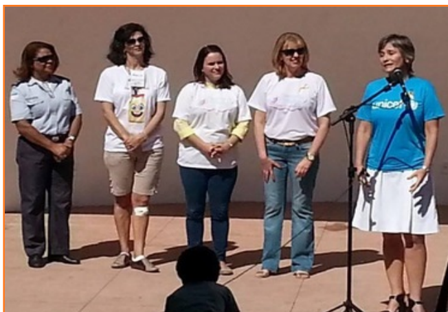
Semana del Bebé