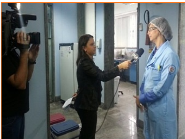
Entrevista en los medios