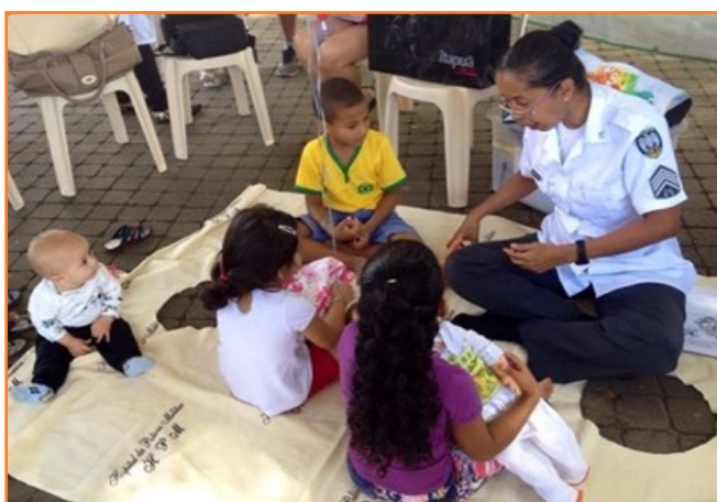
Acciones con niños